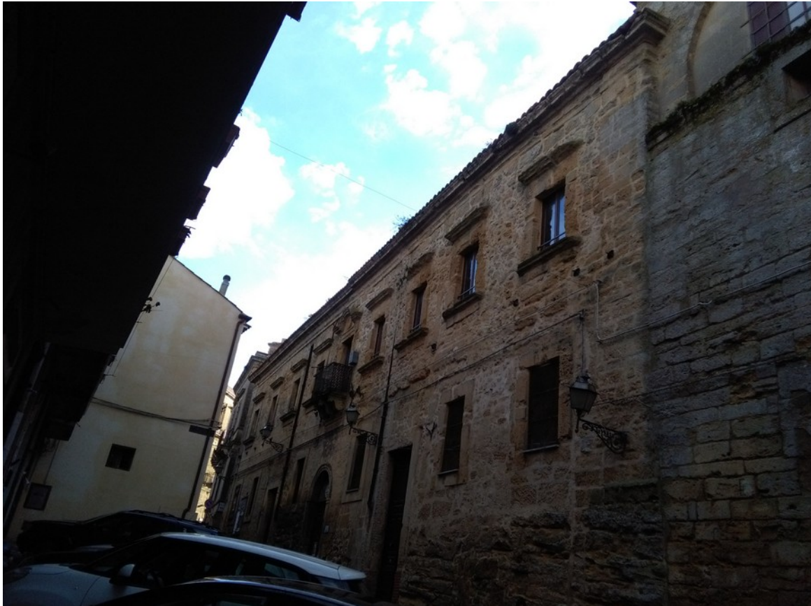
Veduta di via Roma