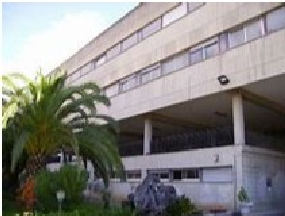
Veduta prospetto principale