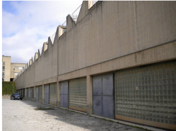
Veduta prospetto retrostante