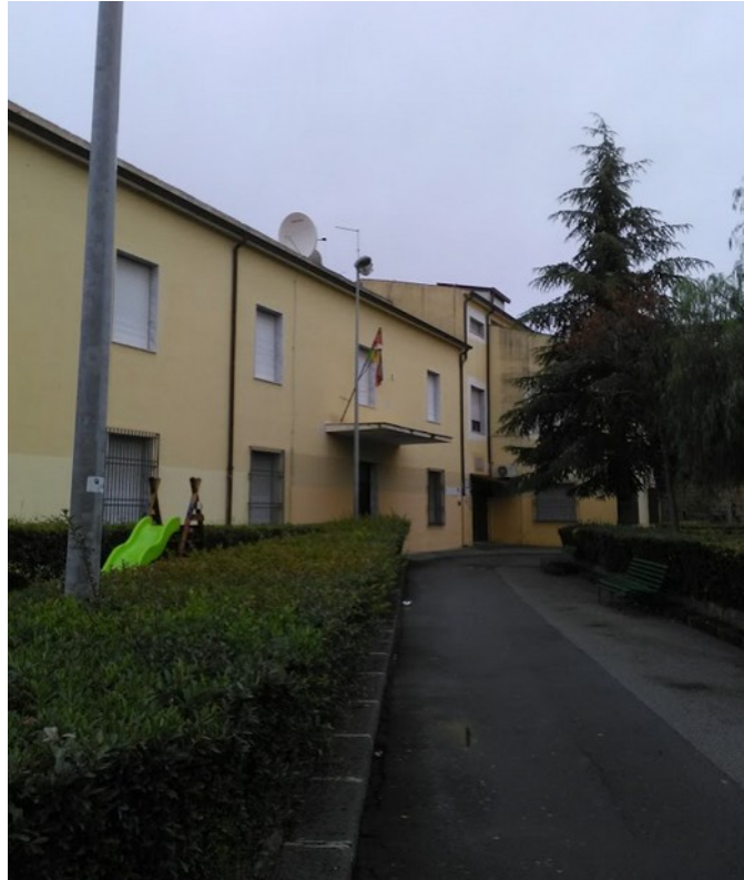
Veduta prospetto principale