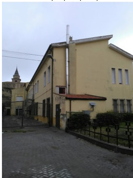
Veduta prospetto retrostante